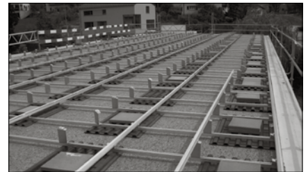
Das neu sanierte Flachdach wird durch eine 1 cm dicke Textilmatte geschützt und trägt die Unterkonstruktion für die Photovoltaikmodule.