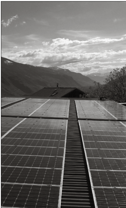
Die fertige Anlage auf dem Schulhaus Paleten

Die Photovoltaik-Anlagen sind zudem bei der KEV (kostendeckende Einspeisevergütung des Bundes) auf der Warteliste. Sollten diese an die Reihe kommen, sieht die Bilanz für die Gemeinde noch viel besser aus. Varen wird dann zum Solarstromlieferanten.