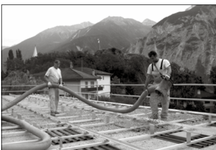
Die Spezialfirma Weiss+Appetito bläst in schonender Weise das Kies zur Beschwerung auf die Unterkonstruktion. Das Flachdach wird nirgends verletzt oder durchbohrt.